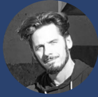
Stefan Thume Webdesign & Medien