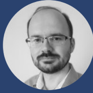
Peter Árendáš Autor