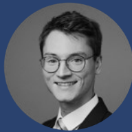
Richard Knirschig Quantitative Analyse & Charts